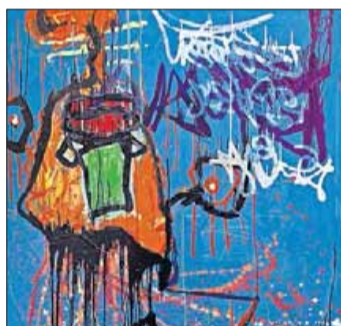
„Blau“ der Künstlerin Nessi wurde erstmals 2016 bei der Trienala Ladina ausgestellt.

Im Drei-Jahres-Rhythmus schreibt das Museum Ladin Ciastel de Tor in St. Martin in Thurn den Kunstwettbewerb Trienala Ladina aus. Daran teilnehmen können unter anderem Künstler, die in den 5 ladinischen Tälern, in Graubünden und Friaul wohnhaft sind. Die Gewinner können ihre Werke in der Kollekt-