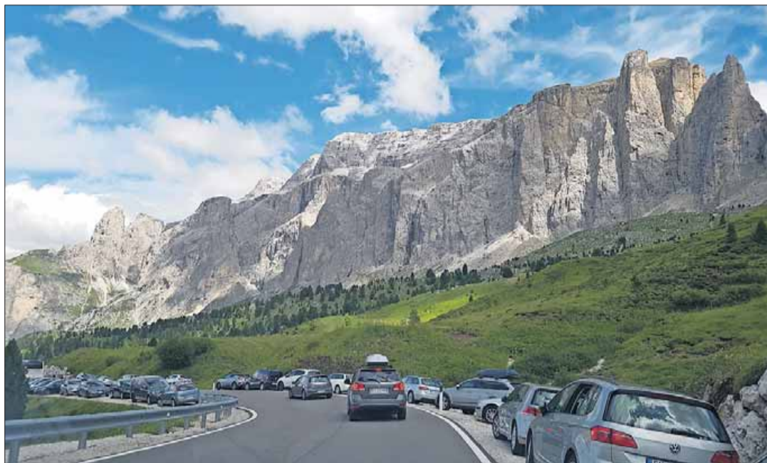
Die Schönheit der Berge rund um das Sellajoch fasziniert viele Besucher. Parken am Straßenrand ist aber in diesem Gebiet verboten, und die Gemeinde will mehr tun, um das Verbot durchzusetzen.

Dass der Verkehr auf den Dolomiten-Pässen aber in Zukunft reduziert werden muss, ist für den Wolkensteiner Bürgermeister Roland Demetz (im Bild) klar: „Wir müssen anfangen zu agieren.“ Die Gemeinde wird daher im Sommer Kontrollen durchführen gegen das wilde Parken. Das will Demetz auch deshalb bekämpfen, weil die Besitzer des