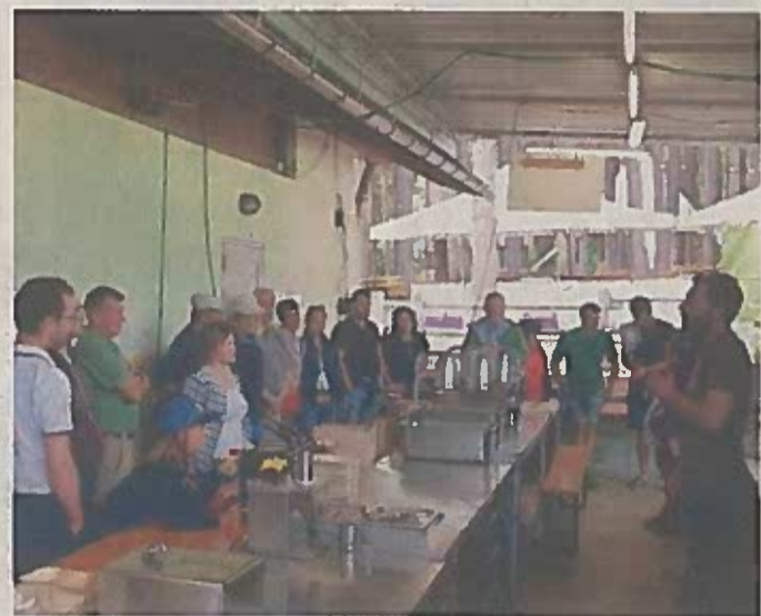
L'organizzazione della festa senza plastica a San Giorgio

Tradizioni e ambiente A S. Giorgio, con i vigili del fuoco, un ritrovo senza usare la plastica